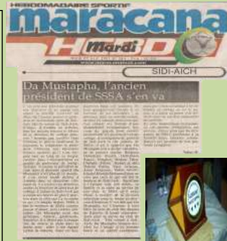
Article de presse, Distinction remise par le Club et Tableau d'Honneur (de l'APC d'El Flaye) après son décès