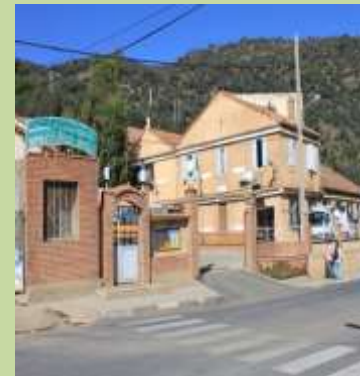
Ecole de Vieux Marché (Souk ou Fella).