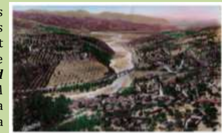
Sidi Aïch dans les années 40